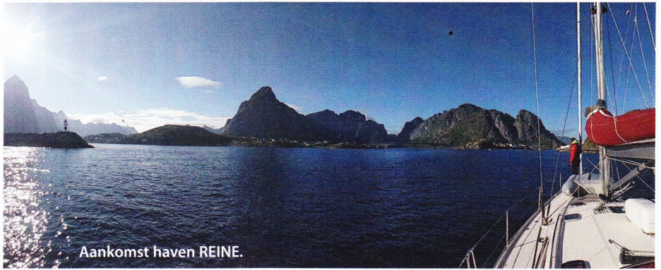
Aankomst haven REINE.

Om 23u stond de zon nog steeds boven de horizon. Niets hield ons dus tegen om al een eerste maal uit te varen. De eerste mijlen stelden ons in staat om het vaargedrag van de boot te voelen, om al onmiddellijk zwaar onder de indruk te komen van de weidse natuur en om verwonderd te blijven over de zon die rond mindernacht wel